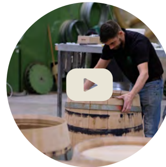
MONTAJE DE LAS BARRICAS