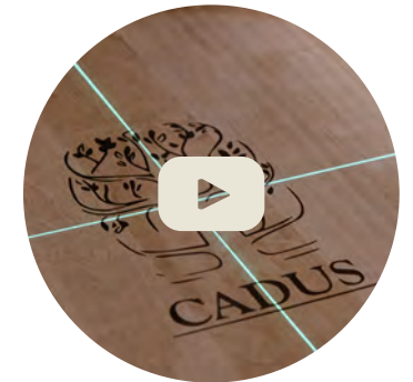
CONTROL Y ACABADO