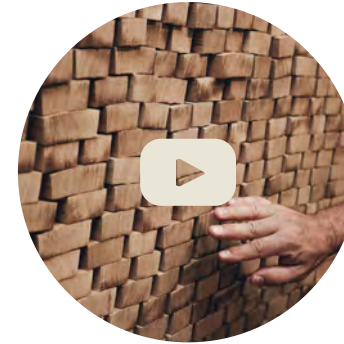
DE LA TABLA A LA DUELA