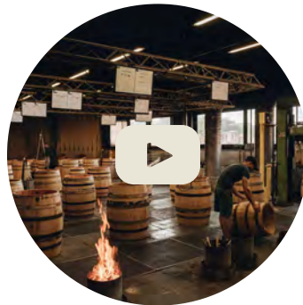
PUESTA EN ARO DE LAS DUELAS Y TOSTADO